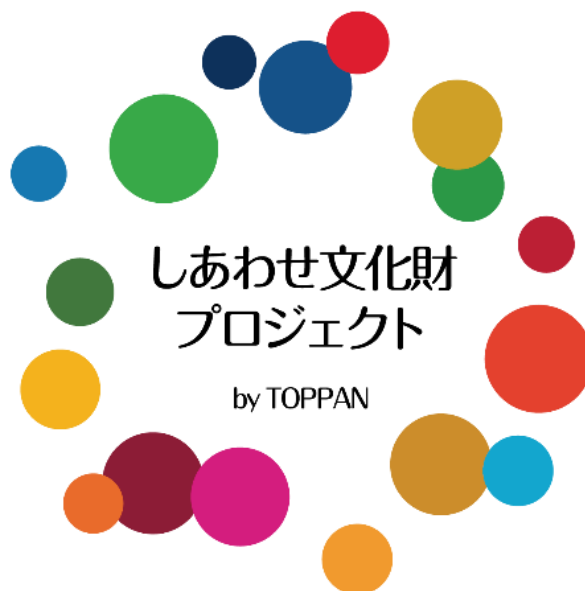
「しあわせ文化財プロジェクト」ロゴマーク

凸版印刷は本プロジェクトの活動を通じ、日本の文化財の魅力を国内外に発信するとともに、文化財の保存・活用支援を促進することで日本の観光立国の実現や地方活性化に貢献していきます。