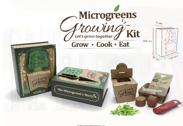
「ワールドスター賞」を受賞したオリジナルデザインパッケージ

なお、本製品は2021年2月24日(水)から26日(金)に開催される「TOKYO PACK 2021-東京国際包装展-」(会場:東京ビッグサイト)の凸版印刷ブース(南1ホール・小間番号S1-12)に出展します。