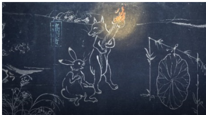
アニメーションシーン

来場者に配布するミュージアムシアターオリジナルうちわを使用し、甲巻にまつわるクイズを出題します。世代を問わず、鳥獣戯画を初めて見る方も楽しんでいただける内容になっています。