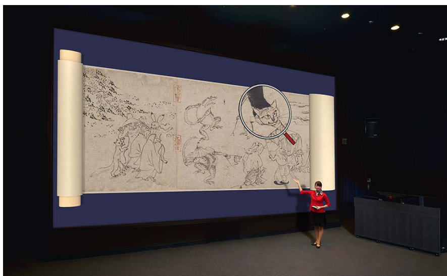
VR 作品『鳥獣戯画 超入門！』