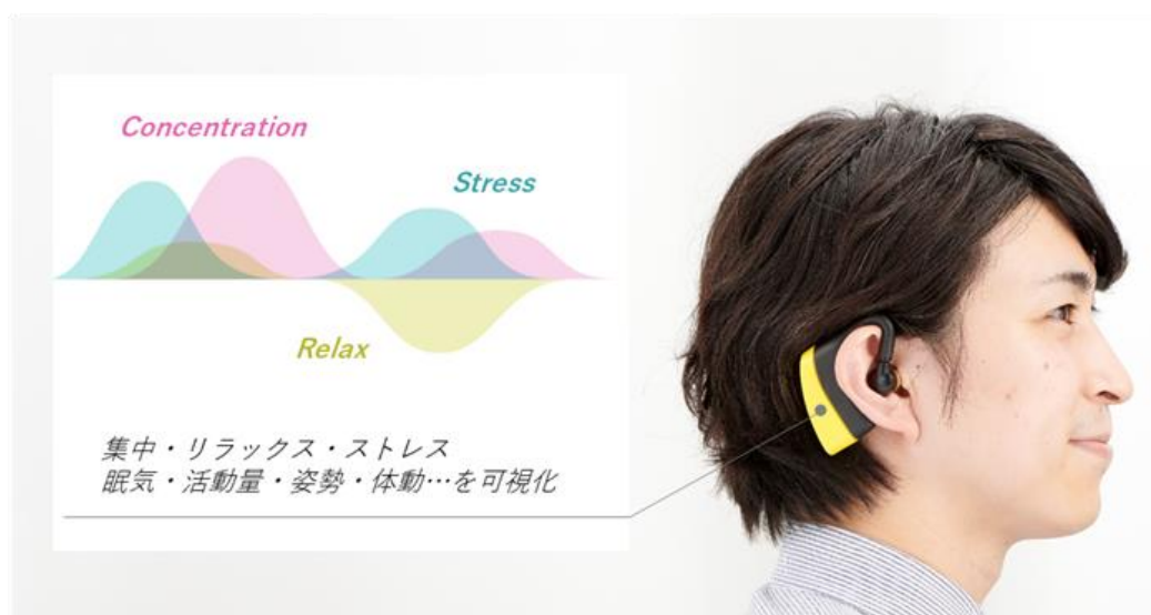
「b-tone™」のイメージ

ワーケーションには、その注目が高まる一方で、企業への導入は足踏み状態が続いているなどの課題があります。この課題を解決するために、凸版印刷のサービスである脳波デバイス「b-tone™」を用い「HafH」の宿泊施設におけるワーケーションを想定した実験を開始。ワーケーションによる向上のエビデンスを集め、ワーケーション導入を後押ししていきます。