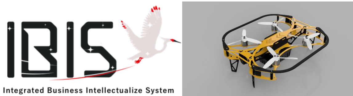
屋内ドローン「IBIS」のロゴ(左)および機体(右)

その優位性を活かし、凸版印刷がこれまで実証実験を行ってきた、屋内空間データのアーカイブやリッチ化などの設備保守・データ利活用分野を中心に共同研究・開発を行い、従来のサービスにドローンの実装を行います。また、将来的には Liberaware とのドローンを活用した共同サービス展開を目指します。