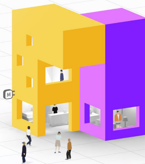
バーチャルショッピングモールアプリ「メタパ™」 サービスイメージ