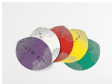
寛永寺 散華(イメージ)