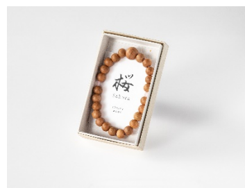
桜腕輪念珠ブレスレット(イメージ)