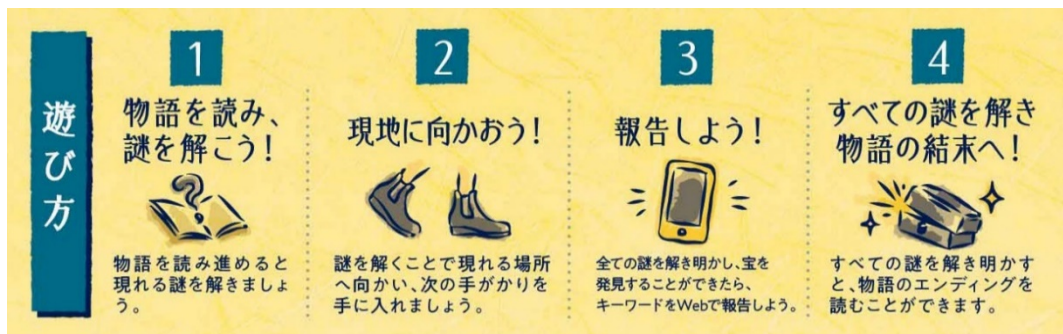
謎解きイベントの遊び方