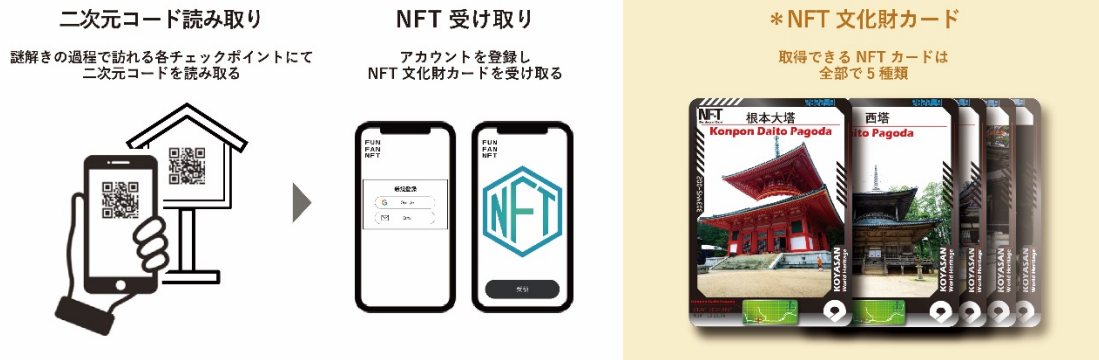
『NFT 文化財カード』の受け取りフロー

「ナゾトキ文化財めぐり『天空の秘境と夢幻手稿』」では、謎解きの過程で訪れる複数のチェックポイントに二次元コードが設置されており、イベント参加者はスマートフォンで『NFT 文化財カード』を受け取ることができます。鑑賞した文化財を思い出として持ち帰るだけでなく、さらに深く知るきっかけをつくります。