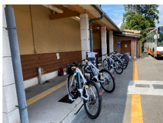
高野山駅前ステーション