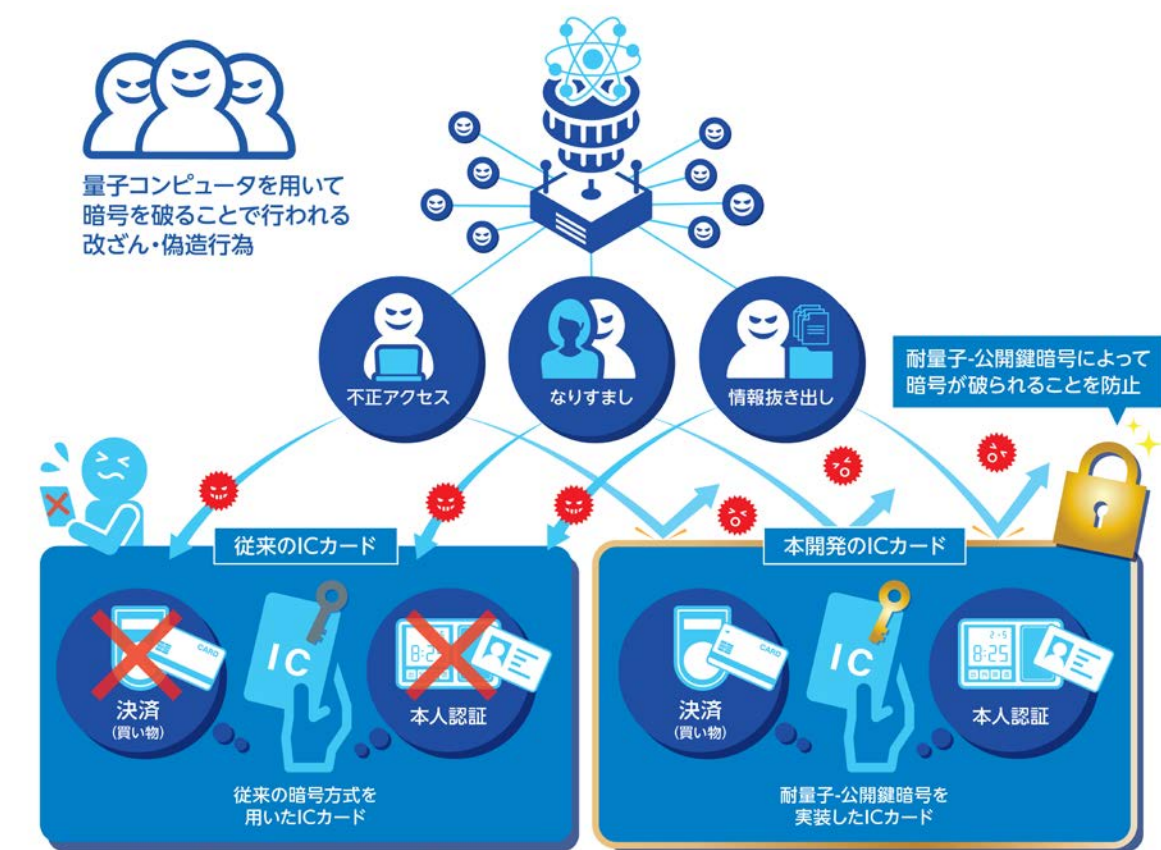
従来の IC カードと「PQC CARD®」の違い

本成果により、PQC を IC カードシステムに実装する技術が確立されるとともに、PQC の普及が進み、量子コンピューティング時代へ向けた暗号インフラのスムーズな移行に繋がると期待されます。凸版印刷と NICT は今後も連携しながら、PQC の早期の普及を図り、世界の安全・安心な情報流通基盤の構築及び維持に貢献します。