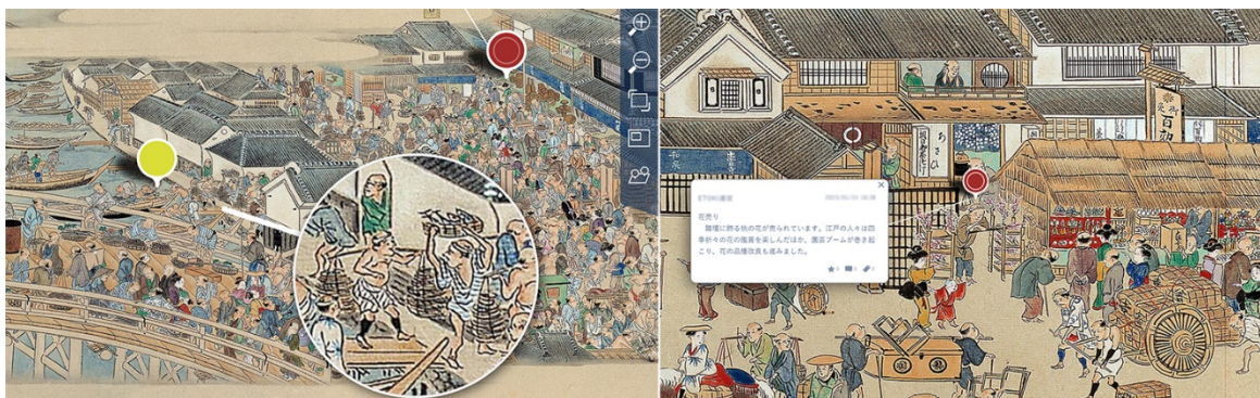
AMF / © bpk / Staatliche Museen zu Berlin, Museum für Asiatische Kunst, former collection of Hans-Joachim and Inge Küster, gift of Manfred Bohms, photography: Jürgen Liepe.

ETOKI™ ONLINE は、博物館や研究機関が所蔵する屏風や障壁画などの絵画や書籍などの作品を、特殊なソフトウェアを用いず、Web ブラウザで閲覧することができるオンラインサービスです。