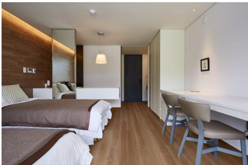
「101 REPREA Smart NANO AREZA」施工イメージ

なお本製品は、2018年11月20日(火)から22日(木)まで凸版印刷が東京にて開催する得意先向けイベント「フォレストフェア 2018 秋」にて紹介します。