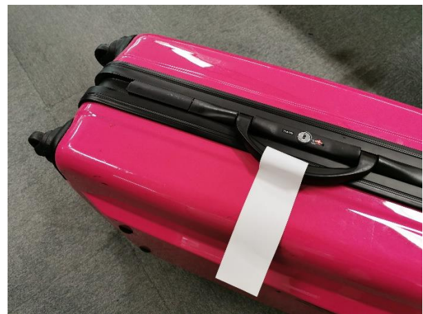
航空手荷物用 IC タグ 使用イメージ (写真は航空手荷物用 IC タグラベルに加工して取り付け)