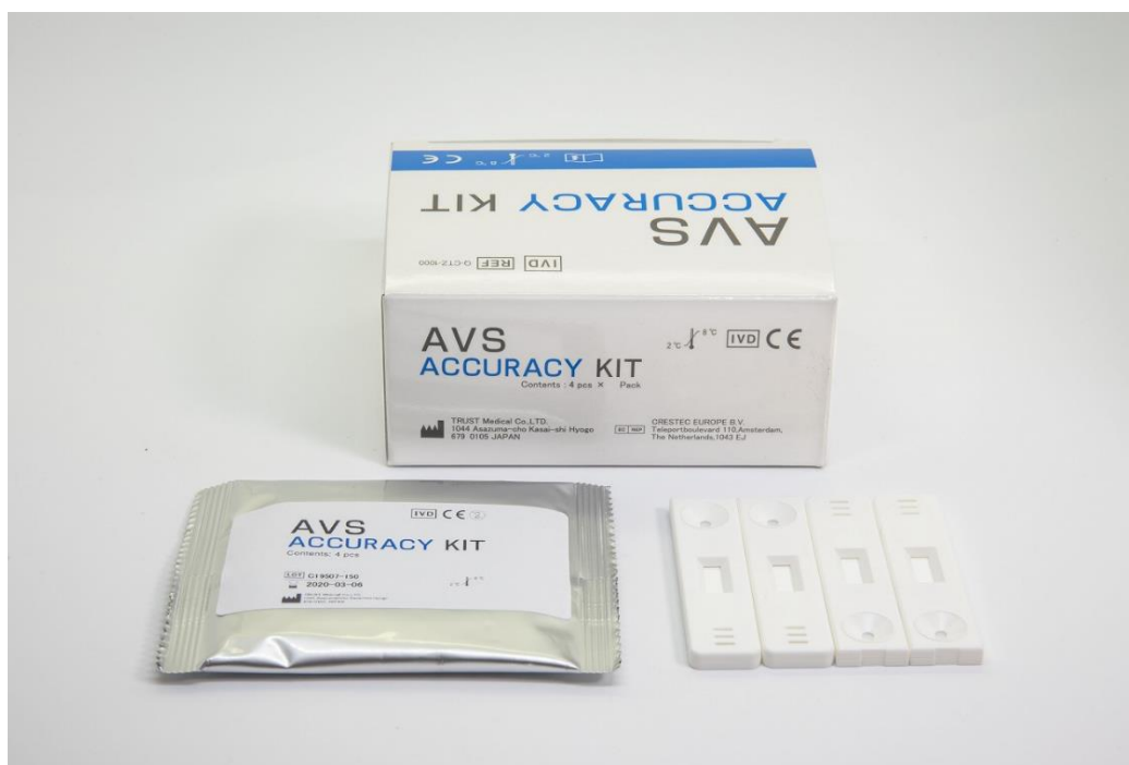
トッパンメディカルファクトリーで製造する体外診断用医薬品の一例

これにより両社のノウハウを融合させ、体外診断用医薬品の開発から製造、医療機関の手元に届くまでをワンストップで提供することが可能になります。