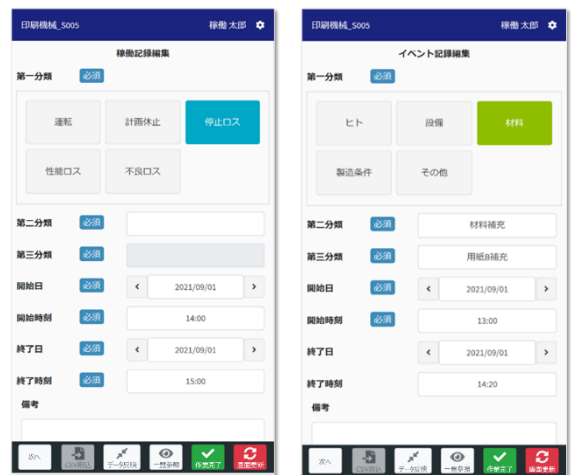
稼働内容/イベント記録編集画面 (運転・休止の情報、ロスの内容を登録します)