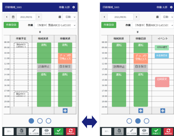
稼働一覧画面 (稼働の予定と実績、イベントを時系列に表示します)

※装置連携には、「DockGator®」(※1)パッケージ他の利用が必要となります。