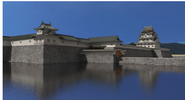
『福井城復元アプリ』より、福井城本丸(左)と堀の外側から眺める城郭(右)