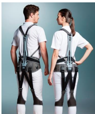
SUPPORT JACKET Bb FIT

ユーピーアール株式会社（本社：東京都千代田区、社長：酒田義矢、以下UPR）は、腰や身体への負担を軽減する、世界で初めて※1の価格2万円台のアシストスーツ「サポートジャケットBb+FIT」を開発しました。第二の背骨※2と腰ベルトのフィッティングシステムを採用した低価格のアシストスーツにより、高齢化・人手不足に悩む職場に導入しやすくなります。