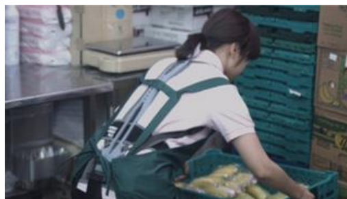
流通・サービス業