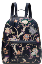
バックパック ¥39,000 (税抜)

ネイビーブルーやクリームカラーを基調にやわらかなレザーの全面にロスリンプリントを色とりどりのスクリーンプリントで施した、発色と繊細な柄が完璧な形で体现されたシリーズはバックパック、2WAYバッグ、クロスボディ、ブランドの象徴的なポケットバッグ、そしてポーチや財布で展開。