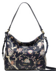
2WAYバッグ ¥37,000 (税抜)