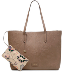
オープントートバッグ ¥48,000 (税抜) W38 x H28 x D14 cm

トレンドのドロースtring開閉のバケツバッグは、やわらかいレザーを使ったボディ部分に滑らかな触り心地のレザーをドロースtringの開閉部分に使用したグレーとパープルの2WAYバッグが2色、70年代からインスピレーションを得て開閉部分にスエードを使用した、型押し仕上げ（エンボス）のタンのショルダーバッグが1色の合計3点を展開。