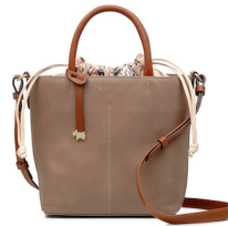
2WAYバッグ ¥37,000 (税抜) W20 x H21 x D10 cm