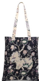
キャンバストートバッグ ¥3,000 (税抜) W34 x H41 cm

ロスリン柄が鮮やかなキャンバスコットントートバッグとレザーキーチャームは、カプセルコレクションのバッグと一緒に持ちたいアイテムとなるでしょう。