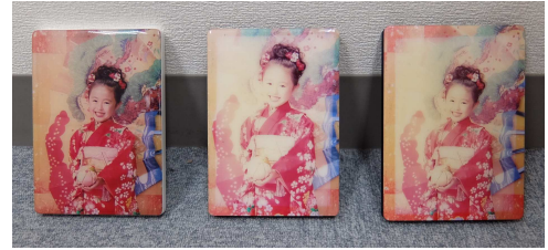
複数のエポキシ樹脂を塗布した写真に、太陽光に近いキセノンランプの光を100時間照射した後の様子。