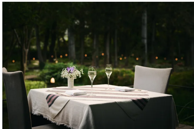
キノコづくしディナー | ウォーターガーデンを眺める特別席