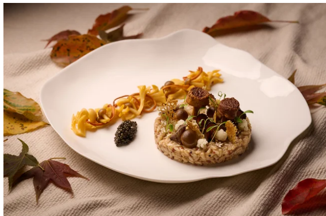
キノコづくしディナー | リゾット

谷關周辺地域は、しいたけをはじめとするキノコ類の産地であり、その生産量は台湾全体の5~6割を占めます。（※3）豊富な食物繊維や栄養素を含むキノコ類は、タイヤル族にとって貴重な食材です。キノコづくしディナーでは、前菜、スープ、リゾット、デザートにキノコがふんだんに使われ、地元の滋味を味わい尽くすことができます。ディナーはウォーターガーデンを望むテラスに設けたテーブルに用意され、心地よい自然の風と共に、料理を楽しむことができます。