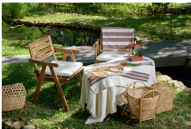
タイヤル黄藤編み体験

海拔2000m以上の高山に生育する黄藤（キフジ・日本語名：トウヤシ）を使い、タイヤル族の伝統的な技法でコースターを作ります。黄藤は、弾力性がありながらも強靱な繊維が特徴で、背負い籠や椅子、寝床の材料として、古くからタイヤル族を含む台湾の原住民に活用されてきました。（※1）地元のタイヤル族講師の指導のもと、自然の音や香りに包まれたウォーターガーデンで黄藤編みに没頭することで、日常から物理的にも心理的に遠く離れることによる、ストレス軽減効果（※2）を得ることができます。