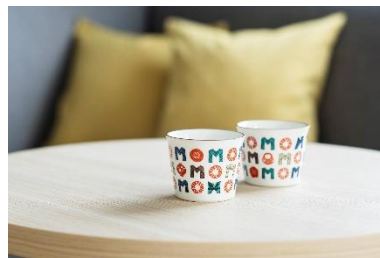
九谷焼そばちょこ