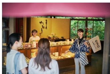
茶菓工房たろう 鬼川店