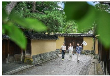
OMO レンジャーツアー