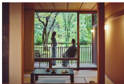
テラス滞在イメージ