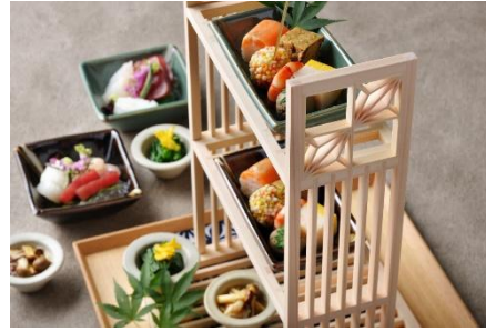
鹿沼組子や益子焼を使った「宝楽盛り」