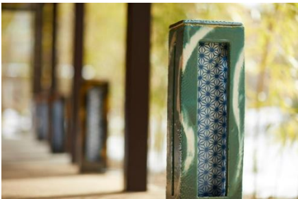
益子焼と黒羽藍染の灯笼

鬼怒川渓流沿いの 36,000 m 2 に及ぶ敷地には緑豊かな森が広がり、自然の中に溶け込むようにして宿泊棟が佇みます。施設の中心には、自然の樹木を活かして設計された中庭が広がり、新緑や紅葉をはじめ四季折々の風景を望みながら、ゆったりと流れる時間を過ごせます。