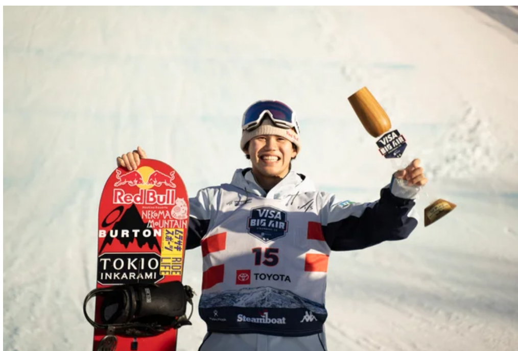
大会後の笑顔の写真

遠征前はネコママウンテンで練習してるので一緒にウィンターシーズンを楽しみましょう！これからも応援よろしくお願いします。