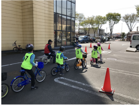
自転車指導教室の風景

TEL: 045-306-5250 MAIL: customer@centrelabo.com