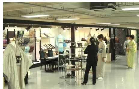
2011年開催の きものサロネ（京都）の様子