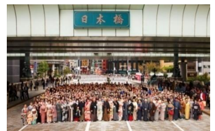
きもの大集合写真 (2011年開催時の様子)

当日着物姿で大集合写真に参加頂ける方を募集しています。 参加いただいた方には、ひざかけをプレゼントいたします。 ※受付場所：COREDO日本橋アネックス広場 10月21日（日）11：00～14：00（当日のみ受付）