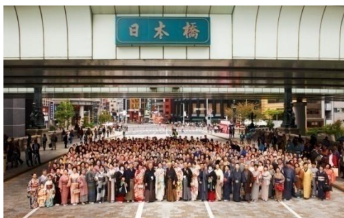
きもの大集合写真 (2011年開催時の様子)

日本橋地域の歴史的建造物を背景に、プロのカメラマンが着物姿の一般参加者を無料で撮影するサービス。事前予約不要。