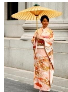
きものフォトセッション (2010年開催時の様子)