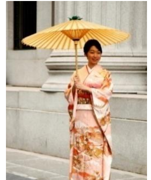
きものフォトセッション (2010年開催時の様子)

開催日時：10月21日（日）11：00～16：00 会場：三井本館周辺、COREDO日本橋アネックス広場 ※雨天時は日本橋三井タワー1階アトリウム 概要：日本橋の歴史的建造物を背景にプロのカメラマンが着物姿の参加者を無料で撮影するサービス。 撮影した写真は後日WEBサイトから各自でダウンロード。 参加条件：着物着用の方（1組あたり、着物着用の方1名以上） 参加方法：当日会場にて先着順で受付（各会場先着60組）。事前予約不要。 費用：無料