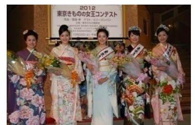
2012年「東京きもの女王」

概要：今年で46回目を迎える「東京きもの女王コンテスト」。応募総数200名の中から選抜された振袖姿の45名から3名の「2013年東京きもの女王」が選ばれます。