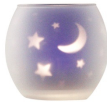
「ムーン&スターライト」