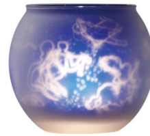
「トゥインクルステラ」