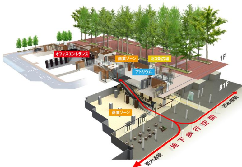
地下歩行空間からのアプローチ