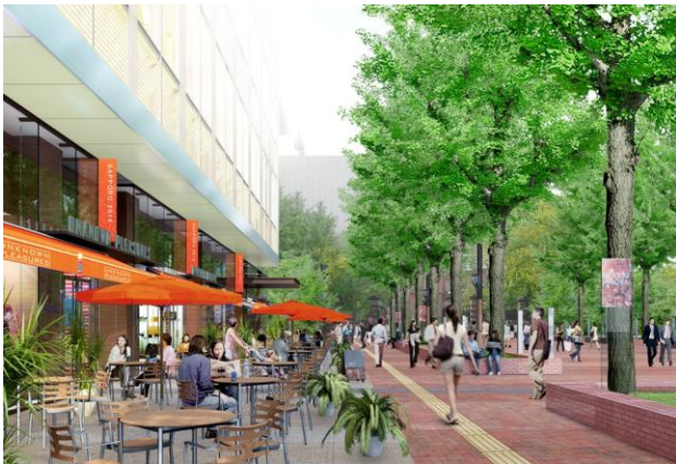
建物低層部（広場側）イメージ

○「(仮称)北3条広場」に面した商業店舗の配置や、地下と地上の往来に配慮したスムーズなアプローチなど、地上部の新たな賑わい創りにも貢献。