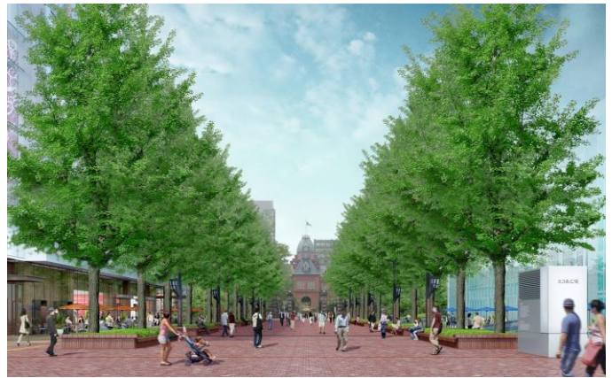
(仮称)北3条広場全景イメージ