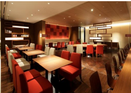
ラウンジ「ノルドリビナ」