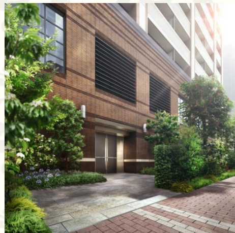
エントランス完成予想CG