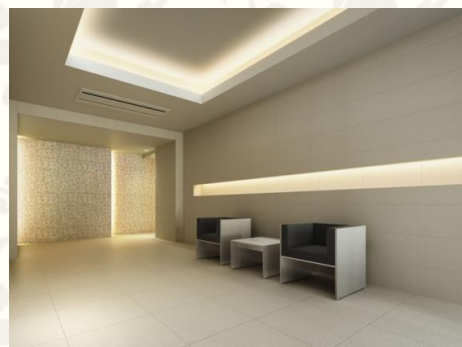
エントランスホール完成予想CG