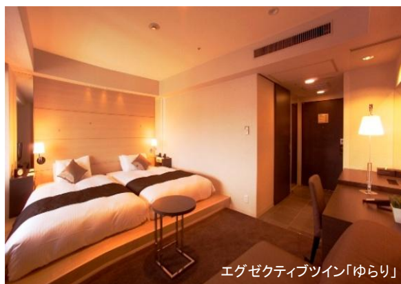
エグゼクティブツイン「ゆらり」