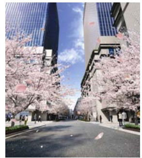
江戸桜通り側ファサード (イメージパース)