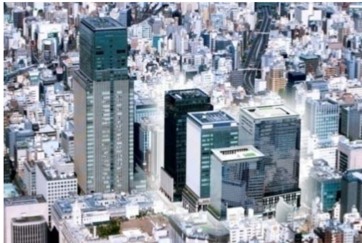
日本橋室町東地区開発計画（イメージパース）