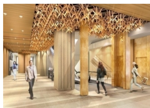
COREDO 室町3 内観（イメージパース）