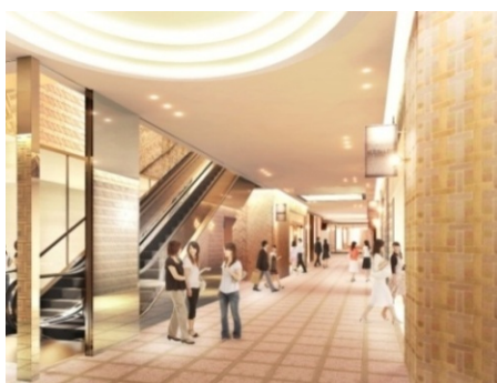
COREDO 室町2 内観（イメージパース）