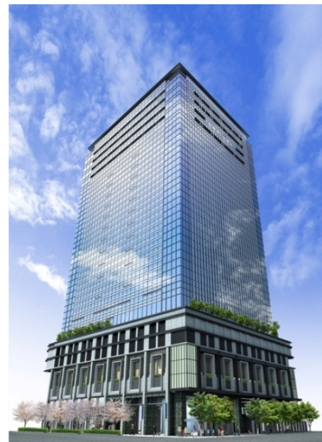
室町古河三井ビルディング (イメージパース)