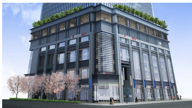
「COREDO室町3」外観イメージパース