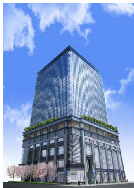
室町ちばぎん三井ビルディング (イメージパース)