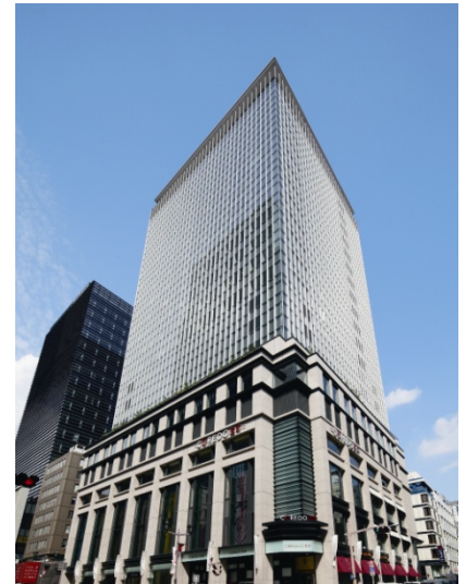
室町東三井ビルディング

※平面駐車場。「室町古河三井ビルディング」、「室町ちばぎん三井ビルディング」の竣工後は、別途、一体の地下駐車場が利用可能。2つのビルの竣工に伴い、別棟タワーパーキング(114台)は解体予定。