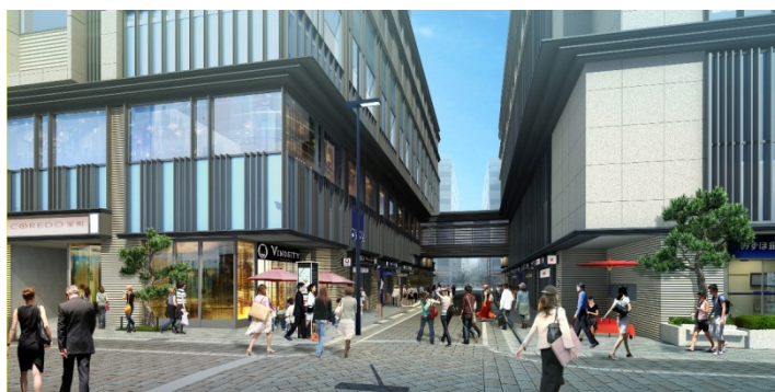
「仲通り」イメージパース