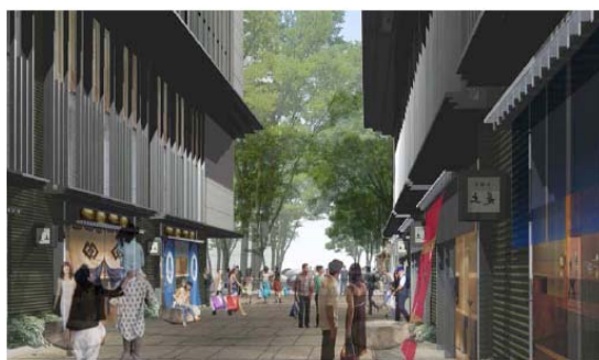
仲通り (イメージパース)