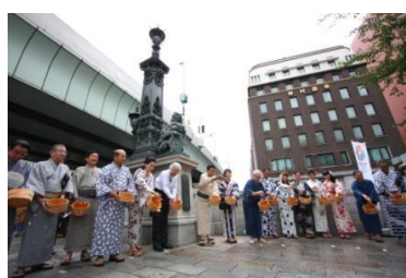
橋の日 打ち水大作戦 (昨年の様子)