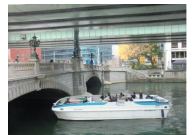
「エセス NANO 1号」

お客様問合せ先：TEL 03-5679-7311 HP： http://www.ss3.jp