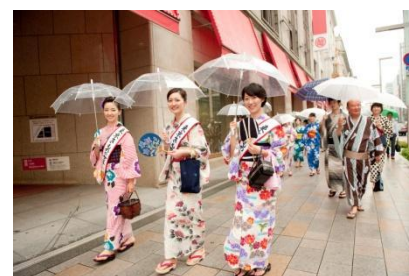
セタゆかたまつり (昨年の様子)

お客様問合せ先：TEL 03-3663-2104 (東京織物卸商業組合) HP： http://www.tafs.or.jp