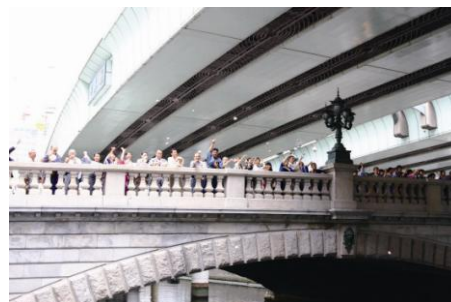
橋の日 打ち水大作戦 （昨年の様子）