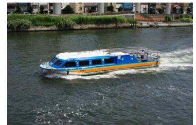
小型水上バス「カワセミ」

HP： http://www.tokyo-park.or.jp/waterbus