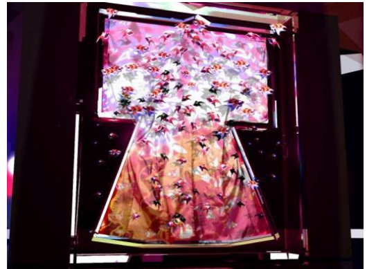
新作「キモノリウム」 作品イメージCG

※「ECO EDO 日本橋 ダイナースクラブ アートアクアリウム 2013 ～江戸・金魚の涼～」のプレスリリースをご用意しております。ご希望の方は上記、プラップジャパン担当者までお問合せください。