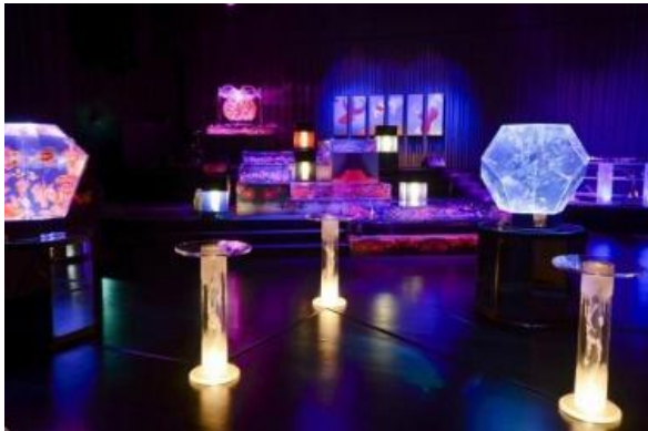
アートアクアリウム 2012 （昨年の様子）