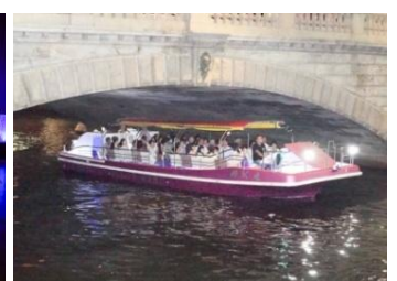
日本橋クルージング 新造船「粋人丸」