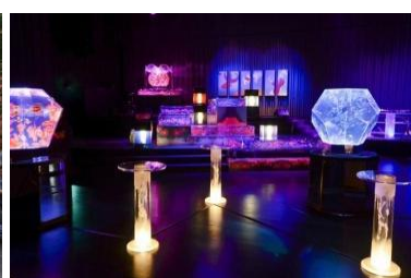
アートアクアリウム 2012 (昨年の様子)