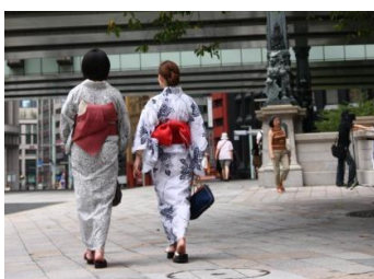
ゆかた・アートアクアリウム特典 (イメージ)

「日本橋」の袂の船着場を起点に、大小様々な船が発着。クルージングで涼を取りながら、数々の橋や東京スカイツリー等の景色がお楽しみいただけます。（開催日・コース等は事業者により異なります。）