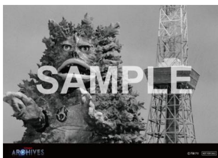
▲イオンシネマ板橋特典