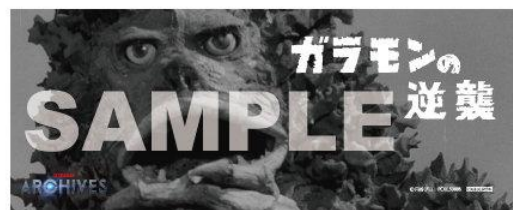
▲ポニーキャニオンショッピングクラブ特典