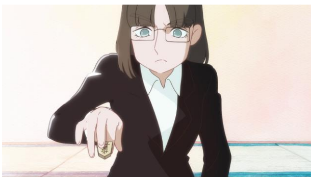
ティザームービーイメージ⑤