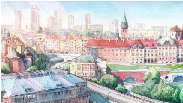
ティザームービーイメージ①

■ティザームービーURL: https://www.youtube.com/watch?v=zZPiz1i9pAE&feature=youtu.be