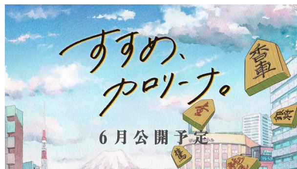
ティザームービーイメージ⑥