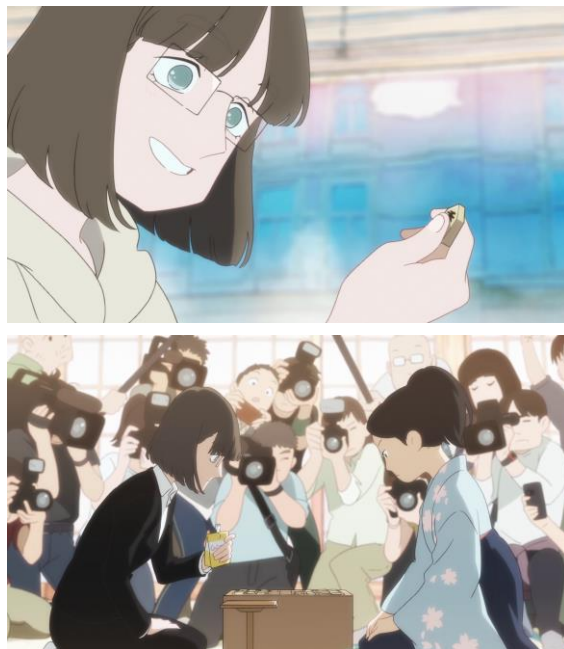
ティザームービーイメージ