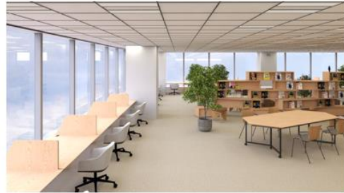
窓際の集中スペース