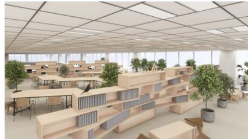
業務に役立つ書籍が並ぶARISE library