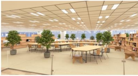
ソーシャルディスタンスが保たれコミュニケーションが生まれやすい ヘキサゴンテーブルが採用されたARISE café