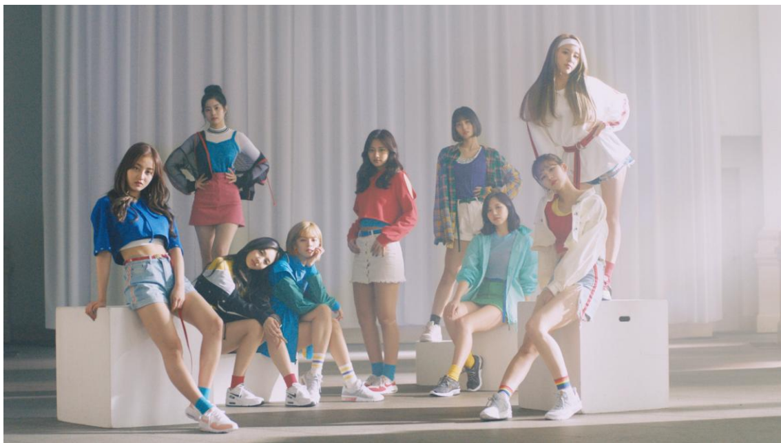
新テレビCM「NIKE AIR MAX」（15秒）