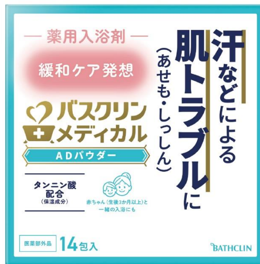
バスクリンメディカル ADパウダー 40g×14包入