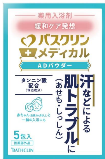
バスクリンメディカル ADパウダー 40g×5包入

2020年3月に発売された「バスクリン メディカルAD」の再販希望の声を多くいただいていたことから、ご要望にお応えし、EC限定品としてリニューアル発売いたしました。毎日の心地よい習慣で、清潔で健やかな肌に導く、緩和ケア発想の薬用スキンケア入浴剤です。入浴効果を高めて、汗などによる肌トラブル(あせも・しっしん)をケアします。