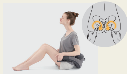
おしりまで届く新設計