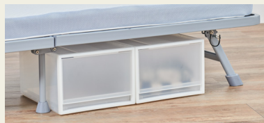
※ 画像はすべてイメージです

高さ27×幅45×奥行45cmの収納ボックスを3つ置けるスペースを確保しました。ベッド下に空間があるので、ロボット掃除機も通りやすい設計です。