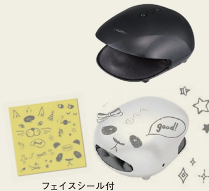
フェイスシール付