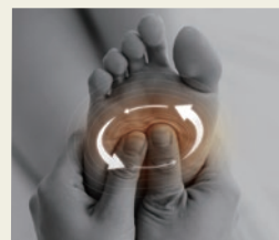
プロもみイメージ

プロのマッサージを受けると、ぐいっと強めに感じるの いつの間にか眠ってしまいそうになる——それは、一定の 動きでなく緩急つけた手技が指圧の心地よさを高めている からです。この“もみ速度”に着目して開発した「プロもみ モード」を搭載しました。もみ玉が1回転する間に速度を 切り替え、もみ速度の緩急でプロの指圧を追求しています。 そのほか、もみの回転がゆっくりで心地よいマッサージが 楽しめる「ゆったりモード」、もみの回転が速い「スタンダード モード」の3つの自動プログラムを搭載しています。