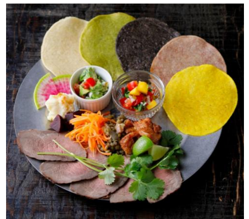
やわらかローストビーフのトルティーヤ巻きプレート 1,300円↓