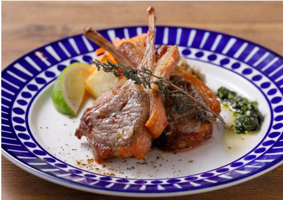
←ラムチョップ 2本 1,180円

人工知能搭載のスチームコンベクションオーブンが最適に焼き上げるため、外はパリッと中は柔らかくジューシーなテイストに仕上げています。