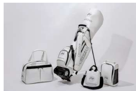
[左から] BOSTON BAG 29,700円、 CADDY BAG 99,000円、CART BAG 16,500 円、SHOES CASE 19,800円