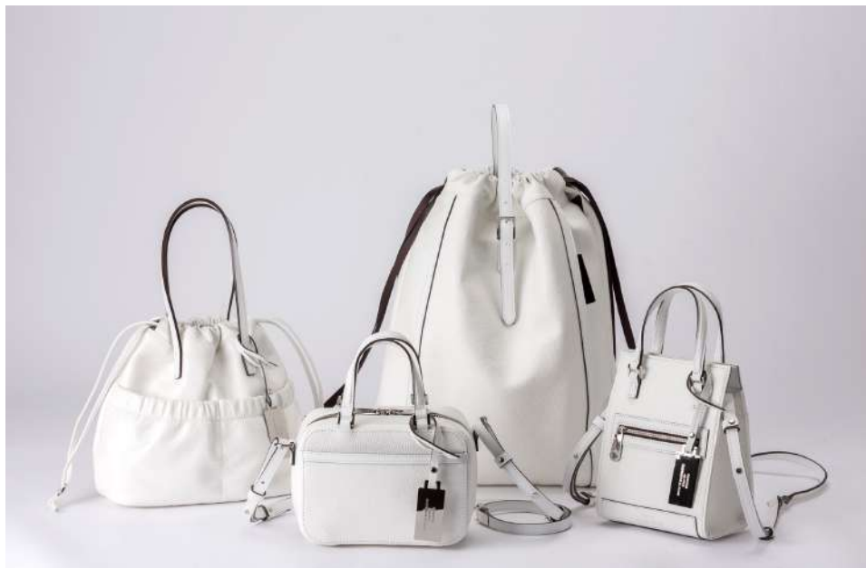
[左から] HANDY KNAP 35,200円、BOX MINI SHOULDER 42,900円、 KNAPSACK 49,500円、SQUARE MINI SHOULDER 42,900円

日本の鞆生産の中心地として千年の歴史を持つ豊岡で生まれた“CREEZAN(クリーザン)”は、1975年の創業以来、一貫して鞆づくりに携わるコニー株式会社(本社:兵庫県豊岡市、代表取締役社長:西田 正樹)のオリジナルブランドです。日本の職人による常識にとられないモノづくりを信条に、上質で洗練された大人の鞆をお届けしています。