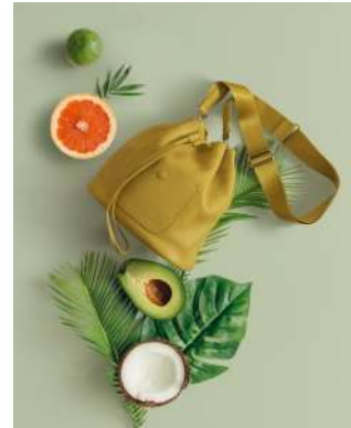
「BOLLA」 ドロースtringショルダー 18,700円