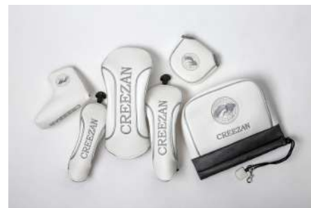
ヘッドカバー 8,800円～9,900円