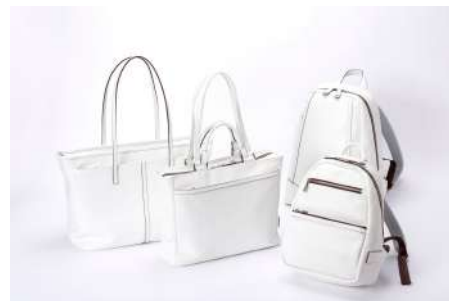
[左から] SOFT TOTE 57,200円、 TWIN TOTE 57,200円、RUCK 64,900円、 MINI RUCK 49,500円

革小物にはカーフのように繊細でしなやかな極上のゴート革を使用。ゴートならではの極小のシボに覆われているため高い強度で傷がつきにくく、強撥水加工を施すことで汚れにも強いヘビユースに最適な仕様です。