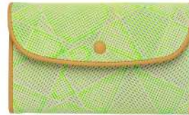
フラップウォレット M 19,800円