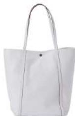
ROUGH TOTE 46,200円