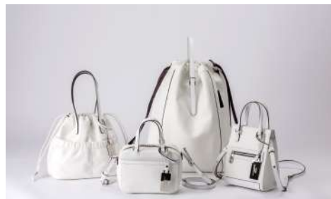
[左から] HANDY KNAP 35,200円、 BOX MINI SHOULDER 42,900円、 KNAPSACK 49,500円、 SQUARE MINI SHOULDER 42,900円

革小物にはカーフのように繊細でしなやかな極上のゴート革を使用。ゴートならではの極小のシボに覆われているため高い強度で傷がつきにくく、強撥水加工を施すことで汚れにも強いヘビースーツに最適な仕様です。