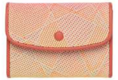
フラップウォレット S 16,500円