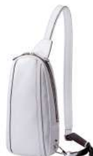
BODY BAG 40,700円