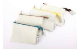
ノベルティ「ミニポーチ」

期間中、「JETTER」を22,000円(税込)以上ご購入いただいた方、先着20名様に手のひらサイズのオリジナル「ミニポーチ」をプレゼント！