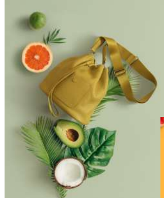
ドロースtringショルダー 18,700円

今回のポップアップストアでは、3月11日発売の新作3型「ドロースtringトート」「ドロースtringショルダー」「ミニポシェット」をはじめとするバッグ各種と人気の財布や革小物をフルラインナップで展開します。