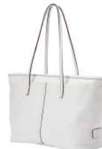
SOFT TOTE 57,200円