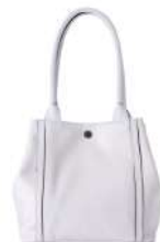
SQUARE TOTE 39,600円