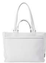
TWIN TOTE 57,200円