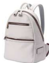
MINI RUCK 49,500円