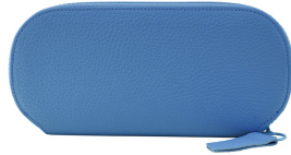
ラウンドウォレット 17,600円