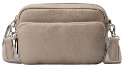
ミニショルダー 18,700円