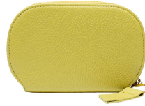
ミディアムウォレット 16,500円