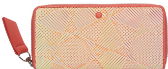
ラウンドウォレット 22,000円

「MANIERA(マニエラ)」シリーズは、イタリア語で芸術家の手法、様式を意味し、明暗のコントラストや色彩・遠近法をイメージしています。表の革は見る角度によって色合いが変化し、独特の雰囲気が漂う個性的なイタリア産の革を採用。イタリアならではの自由な発想でデザインされた革は、職人の手塗りによるため非常に手間と時間がかかっています。「itten-itten」らしいカラフルなカラーリングで、持って楽しい、見て可愛い、女子心をくすぐるデザインです。