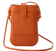
ミニポシェット 13,200円