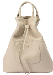
ドロースtringショルダー 30,800円