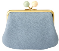
がま口ミニ財布 14,300円