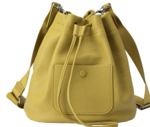
ドロースtringトート 20,900円