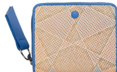
ラウンドミニウォレット 19,800円