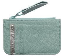
カードウォレット 11,000円