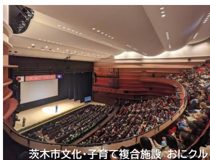
茨木市文化・子育て複合施設 おにクル