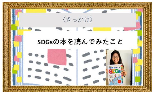
プレゼンテーション部門 柴田 桜来 一般応募(シンガポール)/小 5

【株式会社 otta 賞】 ※協賛企業「株式会社 otta」様より、イラスト部門、プレゼンテーション部門に進出された方の中からご希望の方に抽選で『安心 smart 防犯ブザー:otta.g』をプレゼント