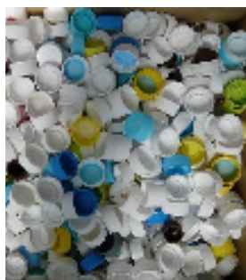
集まったキャップの一部と社員

当社では、発展途上国の子どもたちに日本からでもできる支援はないか考え、身近にある使わなくなったキャップを集めることで、ミャンマー、ブータン、ラオスなど東南アジア諸国の子どもたちにワクチンを提供するというJCVの活動に参加してまいりました。集められたキャップは、NPO団体を通じて、リサイクル製品製造所に売却され、その売却益をJCVへ寄付。JCVがワクチンを購入し支援先国へ贈られています。また、売却したキャップは、雨水貯留浸透製品などのプラスチック製品として再生されています。