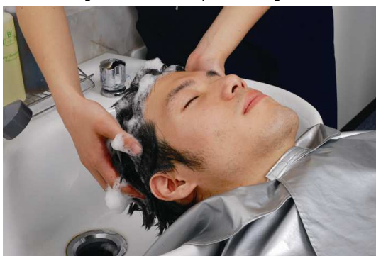
【スカルプシャンプー】