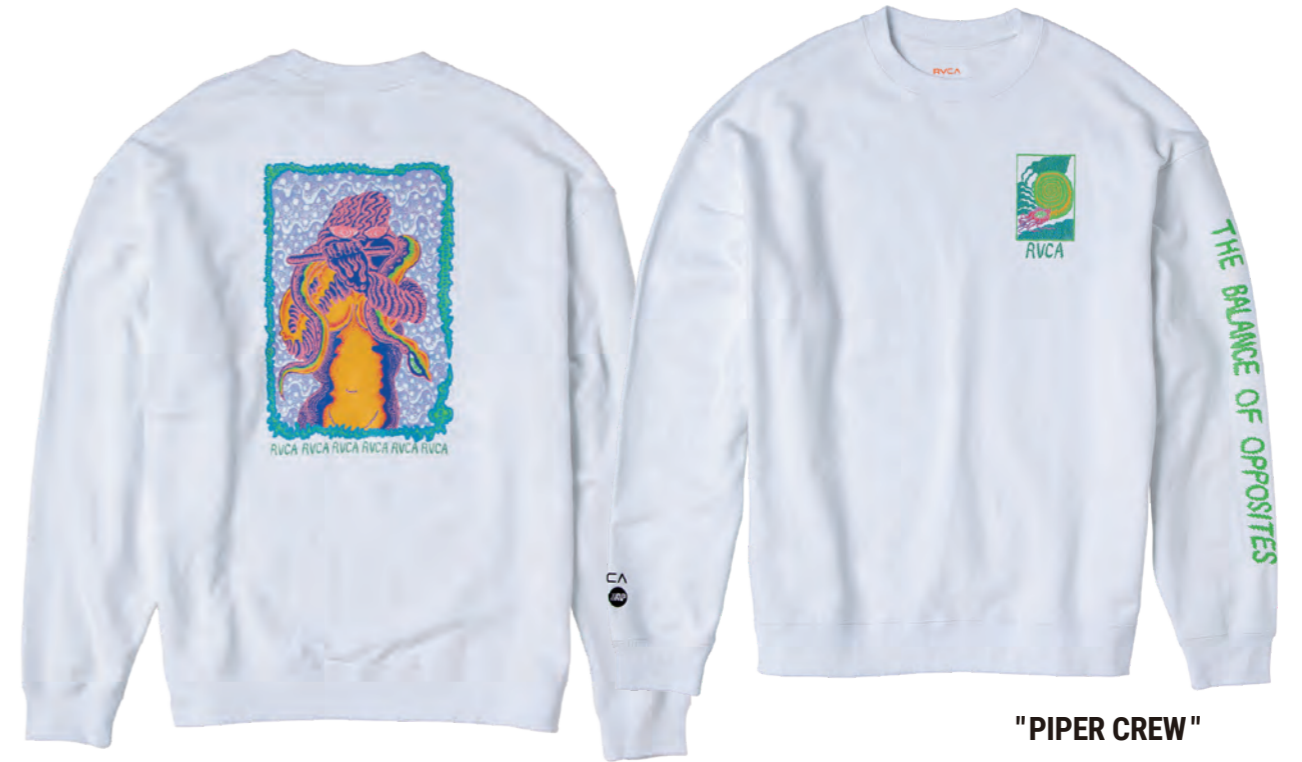
"PIPER CREW" BA042-035 SIZE: S, M, L ¥9,500- (+tax)