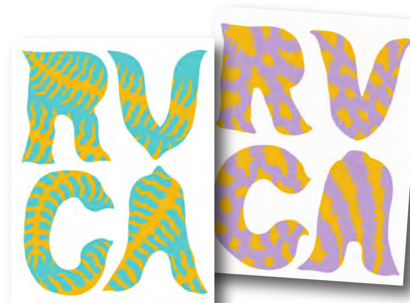
* オリジナルステッカー

RVCA ANP アーティストの TETSUNORI TAWARAYA 氏による 2020 HOLIDAY コレクション発表を記念して、11月27日(金)より RVCA STORE SHIBUYA Gallery (2F) にて期間限定のアートギャラリーが開催となります。