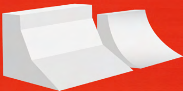
STAGE 2 DOUBLE WALL BANK