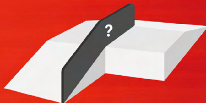
STAGE 3 BANK TO RAIL