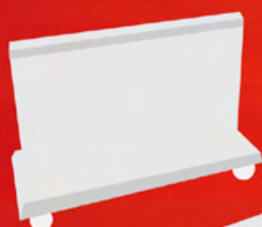
STAGE 0 BANK TO TRAFFIC BOARD